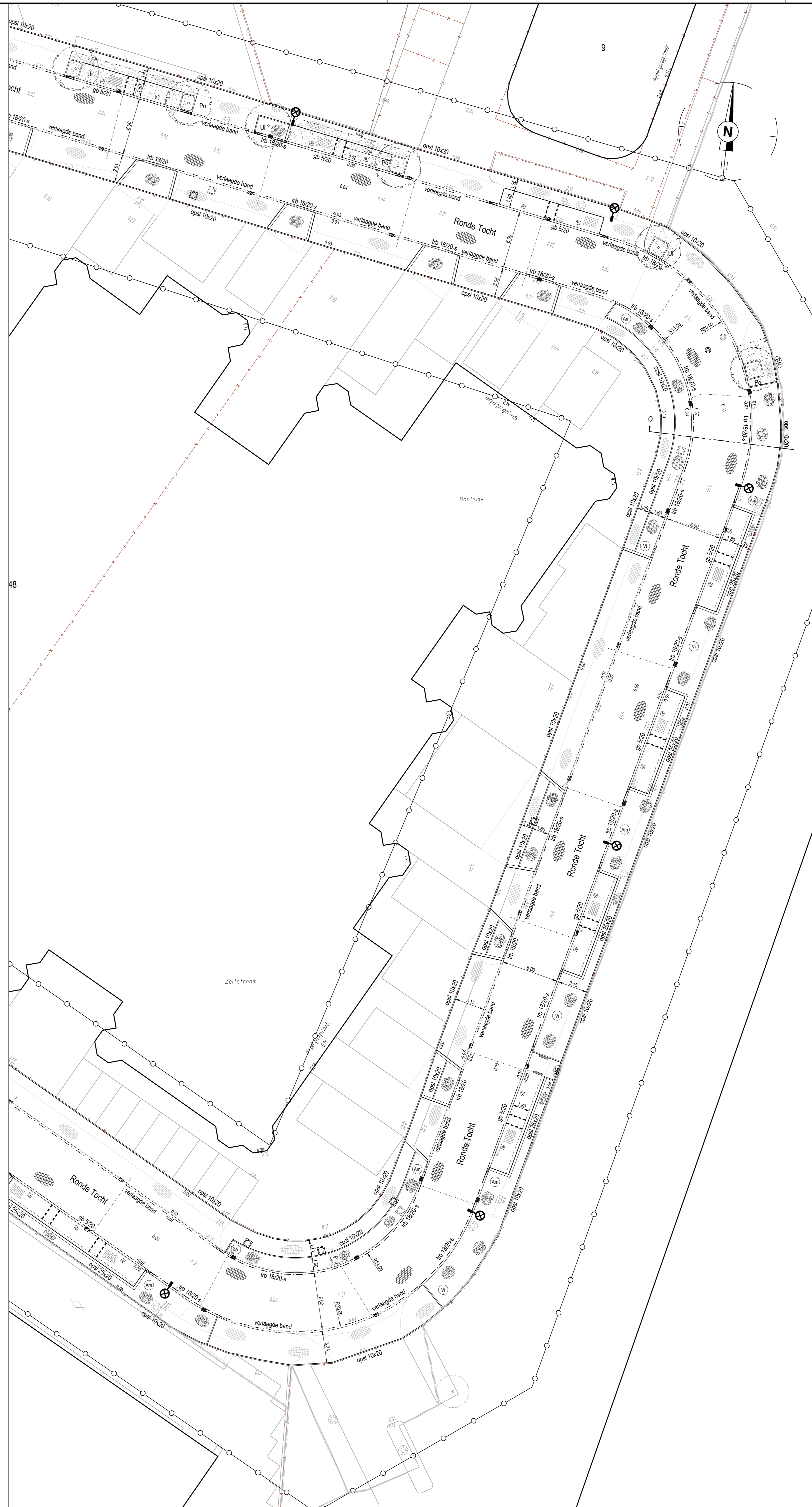
Situatieoverzicht - Blad 6 (gedeelte naast blad 4) Schaal 1:200